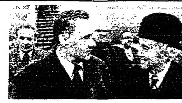
فهمي في موسكو امس، وباستقباله فرديكو

استمرار المباحث بين الملك خالد والملك حسين